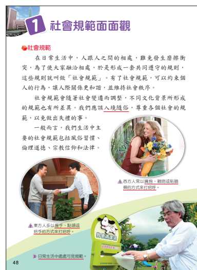
▲康軒社會五上第三單元