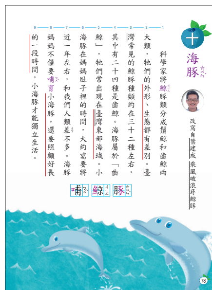
▲康軒國語五上第十課海豚