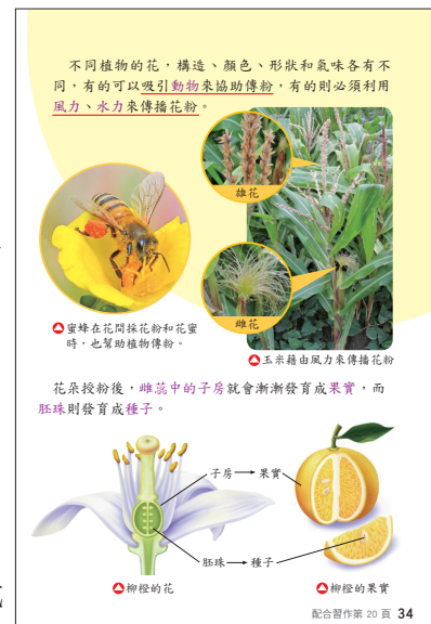
▲康軒自然五上第二單元